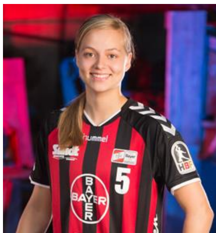
Abbildung 1: HBF-Logo Spielertrikot