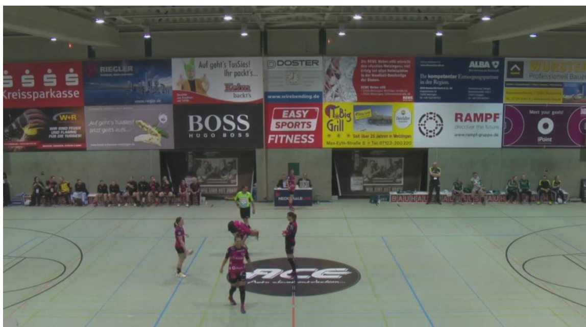
Abb. 3: Einheitliches Gesamtbild / Zusätzliche Bandenwerbung

Türen von Geräteräumen o.ä. sollten grundsätzlich geschlossen bleiben, es sei denn, dies ist für den ordnungsgemäßen Ablauf des Spiels unerlässlich (z.B. Positionierung des Zeitnehmertisches). In diesem Falle sollte der Hintergrund durch ein entsprechendes Banner o.ä. abgedeckt werden.